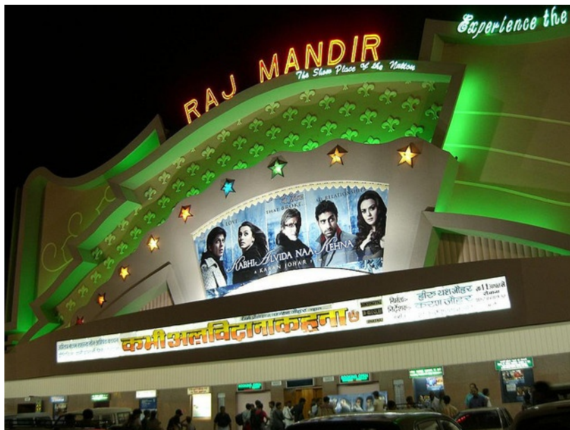
Image d'un cinéma bollywoodien