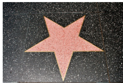
Etoile hollywoodienne par Christian Haugen

Le premier long métrage, marquant la naissance de l'industrie du cinéma à Hollywood - The Squaw Man - fut réalisé en 1914, alors qu'Hollywood avait déjà commencé à produire des courts-métrages depuis 1908.